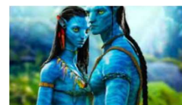
Avatar, J. Cameron

L'anthropologie dans la culture populaire. Le film présente une société extraterrestre fictive avec ses propres coutumes, croyances et structures sociales, offrant une exploration fascinante des concepts anthropologiques tels que l'altérité culturelle et l'adaptation.