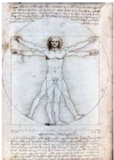
Homme de Vitruve, L. De Vinci

Individu et société : La peinture de la Renaissance se concentrait sur la représentation réaliste de l'individu et de la société. Les artistes représentaient des personnages avec un haut degré de détail, cherchant à capturer l'essence de l'individu et à refléter les normes sociales et culturelles de l'époque.