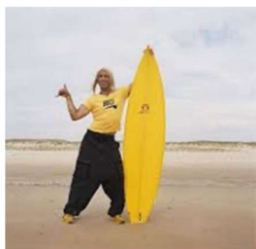
Brice de Nice, Jean Dujardin

Approches méthodologiques : Les recherches en anthropologie de l'art utilisent diverses approches méthodologiques pour étudier les œuvres d'art dans un contexte anthropologique. Cela peut inclure des entretiens avec les artistes, l'analyse visuelle des œuvres, l'étude de la réception des œuvres par le public, et l'examen des influences culturelles et historiques sur les artistes.