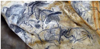
Grotte Chauvet Pont d'Arc 36000 ans

Cavités : Les cavités, telles que les grottes, ont servi de toile aux artistes préhistoriques. Nous étudierons les raisons pour lesquelles ils ont choisi ces lieux particuliers pour créer leurs œuvres.