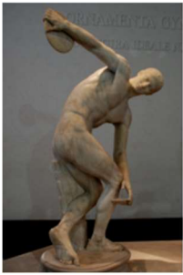
Le Discobole, Myron VIème siècle avant J-C

Idéalisation de la forme humaine : L'art gréco-romain se caractérise par une idéalisation de la forme humaine. Les sculptures et les peintures représentaient des corps athlétiques et équilibrés, mettant en valeur la beauté et la perfection physique.