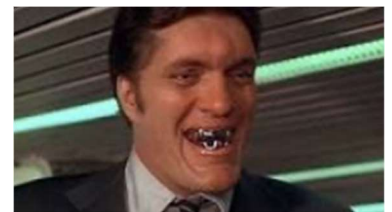
Richard Kiel, James Bond

Analyse anthropologique des personnages : L'analyse anthropologique des personnages de films permet de comprendre comment les valeurs et les croyances culturelles sont représentées. Les choix de personnages, leurs interactions et leurs motivations peuvent révéler des schémas culturels, des stéréotypes et des représentations sociales.