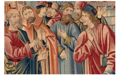
Musée de Cluny

Dépeintion de la société humaine : En plus des thèmes religieux, l'art médiéval dépeignait également la société humaine de l'époque. Les œuvres d'art représentaient des scènes de la vie quotidienne, des portraits de nobles et de paysans, offrant un aperçu de l'organisation sociale et des valeurs de l'époque.