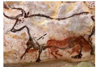
Grotte de Lascaux 17000 ans

Influences culturelles : Les peintures primitives ont été fortement influencées par la culture et le mode de vie des communautés qui les ont créées. Nous explorerons comment ces influences culturelles se manifestent dans les œuvres et reflètent l'anthropologie de ces communautés.