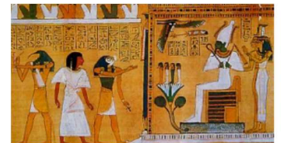
Un défunt devant Osiris, Livre des morts, 1400 BC, British museum

Croyances : Les Égyptiens croyaient en l'existence d'une vie après la mort et l'art égyptien reflétait cette croyance. Les tombes étaient décorées de scènes de la vie quotidienne et de rituels funéraires pour assurer la transition vers l'au-delà.